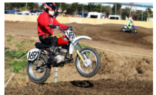
ヴィンテージ MX も楽しめる