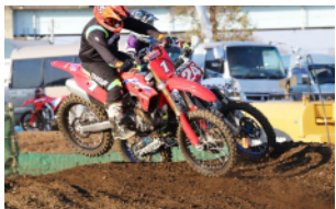
GPクラスヒート2のバトル